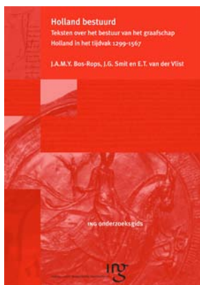
Omslag van de ING-Onderzoeksgids Holland bestuurd .