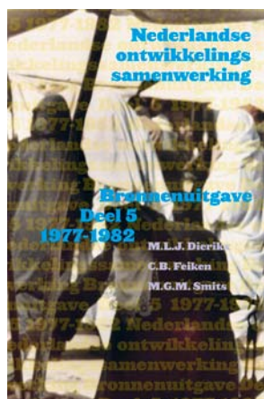
Omslag van deel 5 van de Nederlandse ontwikkelings samenwerking .