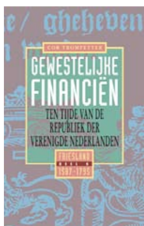
Omslag van deel 6 van de Gewestelijke financiën .

Resolutiën Staten Generaal 1626-1630 , bewerkt door I.J.A. Nijenhuis, P.L.R. De Cauwer, W.M. Gijsbers, M. Hell, C.O. van der Meij en J.E. Schooneveld-Oosterling